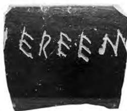
4. Εγχάρακτη επιγραφή σε χείλος σκύφου.