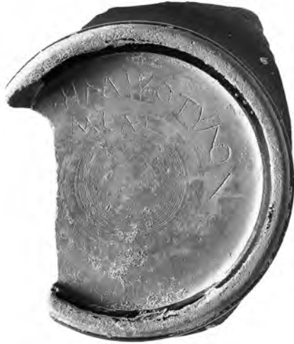
10. Εγχάρκτη επιγραφή σε βάση σκύφου.