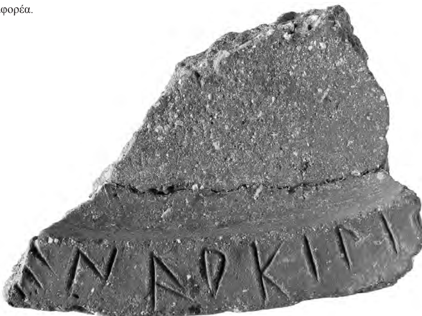
5. Εγχάρακτη επιγραφή σε λεκάνη ή περιρραντήριο (α).