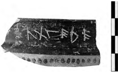
6. Εγχάρακτη επιγραφή σε χείλος κύλικας.