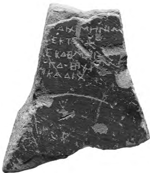
13. Εγχάρκτη επιγραφή σε όστρακο κεράμου.