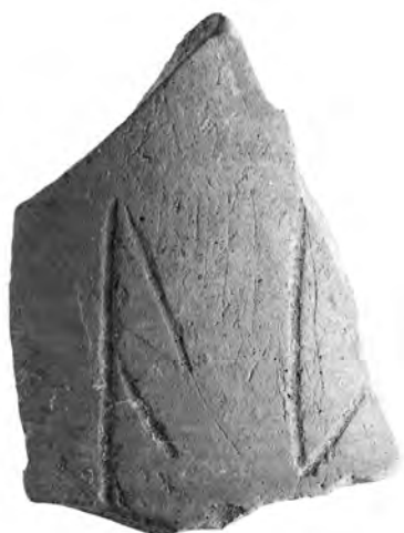
1. Χάραγμα σε λαιμό αμφορέα.