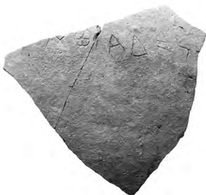
3. Εγχάρακτη επιγραφή σε ώμο αμφορέα.