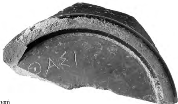
9. Εγχάρακτη επιγραφή σε βάση σκύφου.