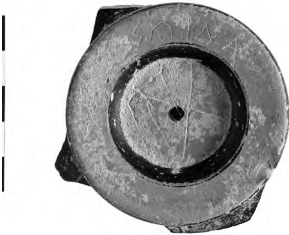
8. Εγχάρακτη επιγραφή και χαράγματα σε βάση σκύφου.