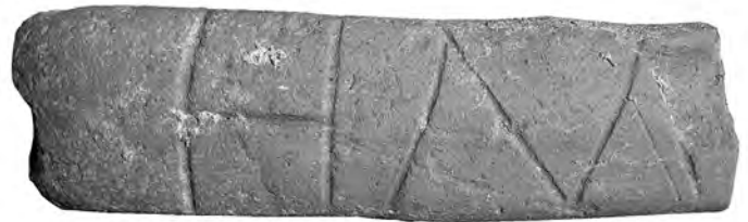
7. Χάραγμα σε λαβή αμοφορέα.