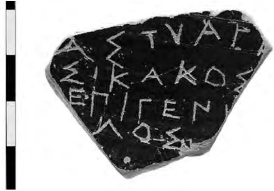
11. Εγχάρκτη επιγραφή σε όστρακο σκύφου.