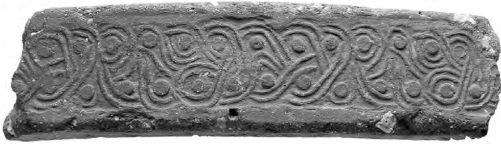
5. Εγχάρακτη επιγραφή σε λεκάνη ή περιρραντήριο (β).