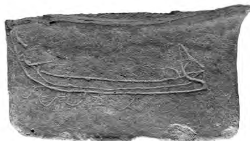
2. Χάραγμα σε λαβή κρατήρα.