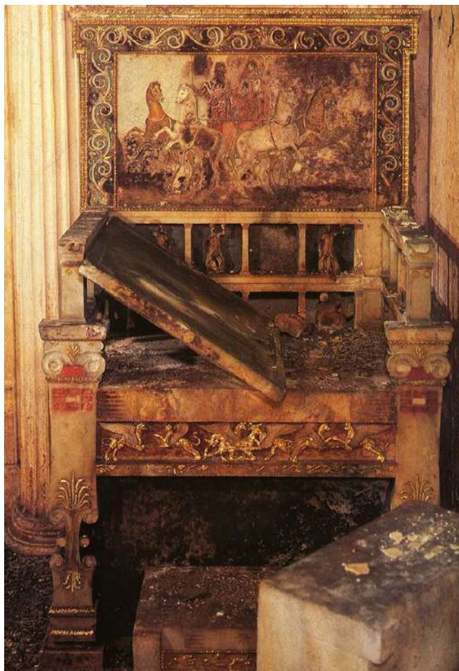
5. Όψη του τάφου της βασίλισσας Ευρυδίκης στις Αιγές (Βεργίνα) όπου εντοπίστηκε και ο μαρμαρινός θρόνος που στο ερσιείνωτο κοσμεύεται από ζωγραφική παράσταση του άρματος του Άδη και της Περσεφόνης. Η Ευρυδίκη, σύζυγος του Αμύντα Γ' και μητέρα του Φιλίππου Β', πέθανε το 344/343 π.Χ.

Όπως και αν έχουν τα πράγματα, θα πρέπει να υπογραμμιστεί με ιδιαίτερη έμφαση ότι οι κατηγορίες αυτές δεν πρέπει να θεωρούνται ως «αεροστεγείς», 15 καθώς τα κείμενα όλων των κατηγοριών είναι αλληλένδετα και αλληλοσυμπληρώνουν το ένα το άλλο. Η παραπάνω ταξινόμηση έχει ως στόχο τη μελέτη αυτών των κειμένων με βάση κυρίως τις σημαντικές μεταξύ τους ομοιότητες (η προσέγγιση του γενεαλογικού στέμματος). Ένας άλλος στόχος εξίσου σημαντικός για τη μελέτη τους είναι η μετατόπιση της έμφασης από τις ομοιότητες στις διαφορές και, αντί του ενός κυρίαρχου κειμένου πίσω από τα κείμενα αυτά, να εξετασθεί η πιθανότητα μέσα στα ίδια βακχικά-ορφικά συμφραζόμενα για τη μετά θάνατον ζωή ή και ακόμη και μέσα στην ίδια κατηγορία κειμένων, να υπήρχαν ταυτόχρονα «κυρίαρχες» και «περιφερειακές» ιδέες και κείμενα, για τα οποία ίσως πρέπει να ληφθούν υπόψη οι τοπικές, ή ακόμη και οι προσωπικές, λατρευτικές και θρησκευτικές απόψεις. Από τα δεκαέξι επιστόμια του καταλόγου, τα αρ. κατ. 93–98 είναι κείμενα της «μνημοσύνης» ή της τοπογραφίας του Κάτω Κόσμου· τα αρ. κατ. 100–102 είναι παραδείγματα κειμένου χαιρετισμού που απευθύνεται στους θεούς