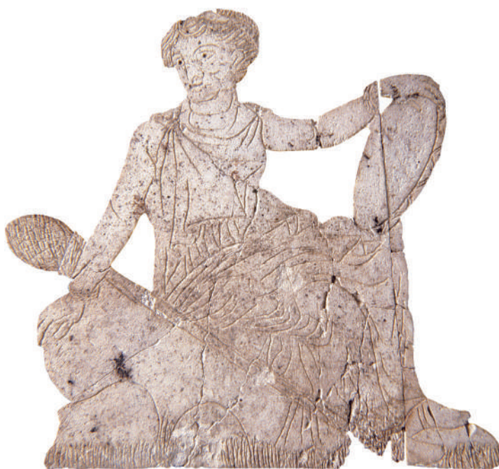
7. Μαινάδα, μέλος του Διονυσιακού θιάσου. Αρ. κατ. 104

Μεταξύ όμως των δύο αυτών αντιθετικών αντιλήψεων των οπαδών του Διονύσου για τα επίγεια και τα επέκεινα, ή πιθανόν και πέραν των αντιλήψεων αυτών, υπάρχουν ασφαλώς περισσότερα παραδείγματα