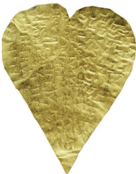
6. Χρυσό έλασμα σε σχήμα κισσόφυλλου. Αρ. κατ. 99α

Όταν κατεβεί στον Κάτω Κόσμο, ο νεκρός θα φτάσει σε ένα ορισμένο σημείο όπου θα βρεθεί αντιμέτωπος με τους φύλακες. Για να του επιτρέψουν να πει νερό, οι φύλακες του υποβάλλουν τις συνήθειες ερωτήσεις αναγνώρισης: «ποιός είσαι; από πού κατάγεις;» στις οποίες ο νεκρός θα πρέπει να απαντήσει με μία από τις παρακάτω κωδικοποιημένες φράσεις/σύμβολα: «είμαι γιος της Γης και του έναστρου Ουρανού»· «η γενιά μου είναι ουράνια»· «κατάγομαι από τη γενιά των ολβίων»· «το όνομά μου είναι Αστέριος»· «έχω το αιώνιο δώρο της Μνημοσύνης»· «άνδρας-παιδί-θύρος» (ανδρικεπαιδόθυρον), Βριμώ· «κατέχω τις μυστικές τελετές και τις τελετουργίες του / της ...». 19 Η δραματική αυτή στιχομυθία σφραγίζει τη μοίρα του μύστη στον Κάτω Κόσμο καθώς του επιτρέπεται να σβήσει τη θανατηφόρο δίψα και να ξαναγεννηθεί. Αυτό παρουσιάζεται εύστοχα στο κείμενο της Θεσσαλίας (D2AB, αρ. κατ. 99)