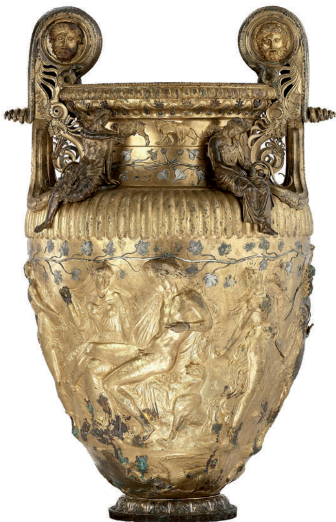
4. Ορειχάλκινος ελικωτός κρατήρας από τάφο στο Δερβένι Θεσσαλονίκης, 340 περίπου π.Χ. Εικονίζεται ο Διόνυσος με τον πάνθηρά του και Μαινάδες να χορεύουν ολόγυρα. Στον ώμο του αγγείου χυτά αγαλμάτια Διονύσου και Μαινάδας

σωζόμενο υλικό που σχετίζεται με τον Ορφέα και τις διδασκαλίες του είναι αντιφατικό, ενώ δεν είναι βέβαιο εάν ο Ορφέας ήταν ή όχι ιστορικό πρόσωπο. Σε κάθε περίπτωση, ενώ ο Ορφέας σχετίζεται και με τον Απόλλωνα και με τον Διόνυσο, δεν ταυτίζεται πλήρως με κανέναν από τους δύο αντίθετους, επιφανειακά τουλάχιστον, θεούς. Σύμφωνα με τις πηγές τις σχετικές με τους Ορφικούς, 12 ο Ορφέας, υιός του Οιάγρου και της Καλλιόπης ή άλλης Μούσας, ήταν ένας εξαιρετικός μουσικός, μάντης και ποιητής, ο οποίος αναμόρφωσε μεταξύ άλλων και τις διονυσιακές τελετές και λατρείες στη Θράκη, γεγονός που οδήγησε στον τραγικό του θάνατο, αν και οι σχετικές μαρτυρίες ποικιλούν. Αυτή η «περίεργη» σχέση του Ορφέα με τον Διόνυσο προεκτείνεται και στα προσωπεία/ personae που οι δύο μοιράζονταν: ο Διόνυσος, ο βάκχος, ο μάντης και προφήτης, ο τελεστής και ποιητής, ιδρυτής των τελετών και της ποίησης,