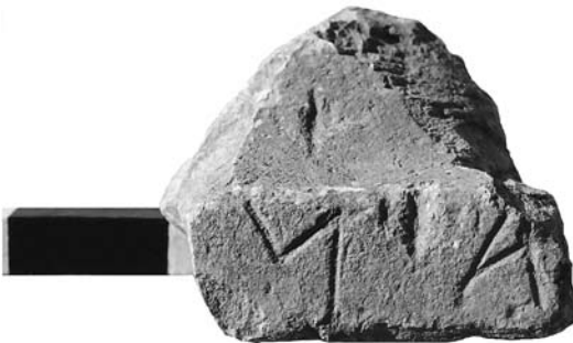
Ειχ. 2. (Μουσείο Ρεθύμνου E263)