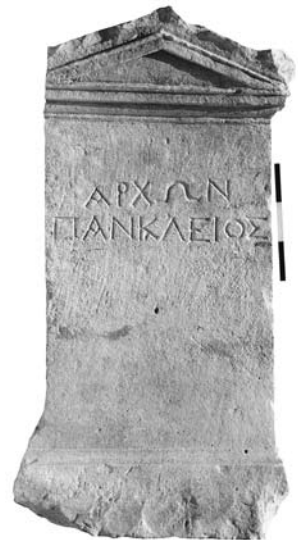
Ειχ. 3. (Μουσείο Ρεθύμνου E262)