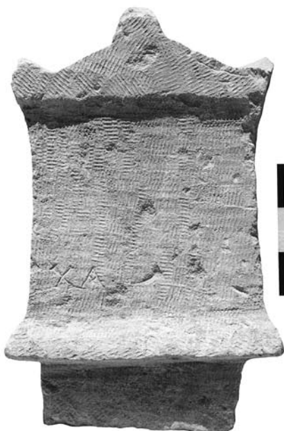
Ειχ. 5. (Μουσειο Πεθύμνου E260)