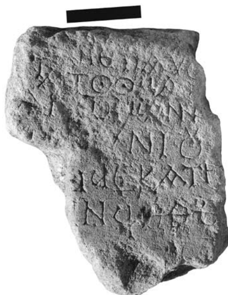
Ειχ. 6. (Μουσειο Πεθύμνου E257)