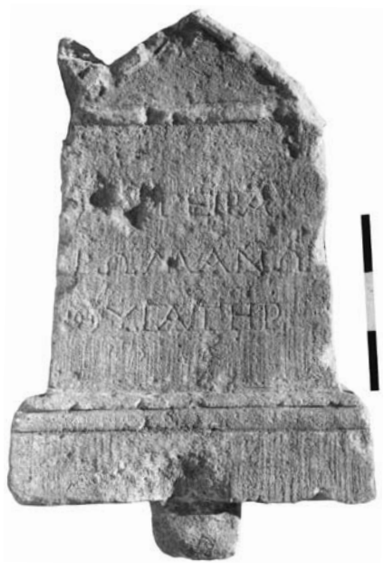
Ειχ. 4. (Μουσειο Πεθύμνου E103)