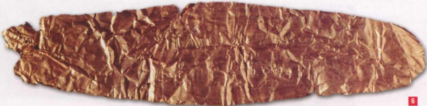
6. Σφακάκι, Μουσείο Ρεθύμνου (Μετάλλινα 896), φωτ. Σ. Αλεξάνδρου

[ἀλλ' ὦ Κρηῆτες, Ἴδης τέκνα] Φοινοκογενοῦς τέκνον Ἐυρώπης καὶ τοῦ μεγάλου Ζηνός, ἀνάσσων