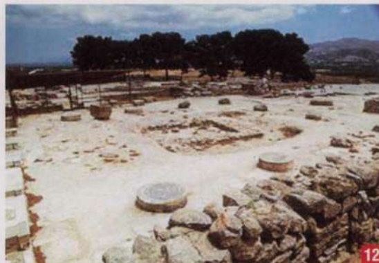
12. Στη Φαιστό τελούνταν μυστηριακές λατρείες του Δία