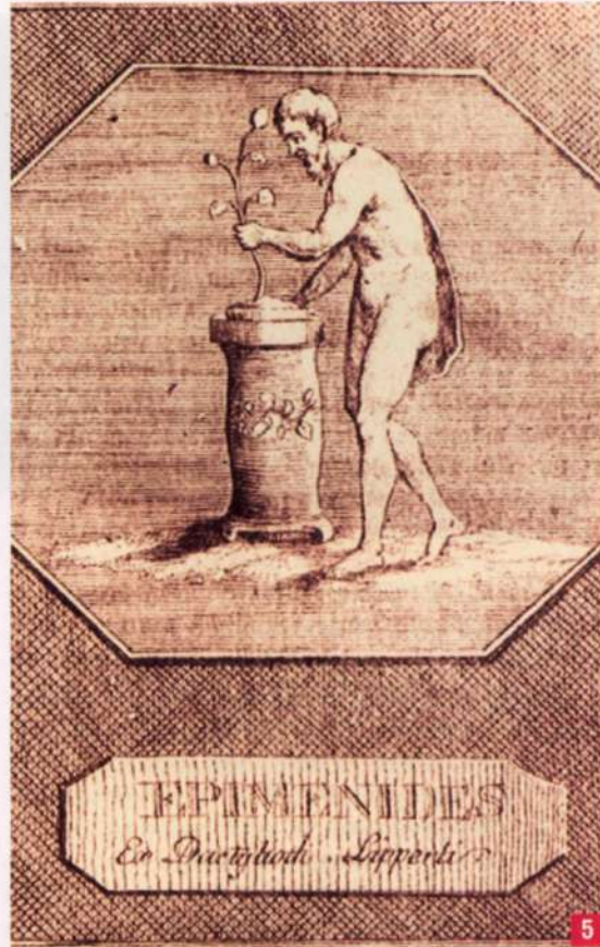
5. Ο Κρητικός μάντης και ιερέας του Δία, Επιμενίδης, σε αναγεννησιακή χαλκογραφία

Αν υπήρχαν μόνον αυτά τα χρυσά ελάσματα, τα προβλήματα ερμηνείας τους δεν θα ήταν ιδιαίτερα περιπλοκά. Υπάρχουν τουλάχιστον δύο επί πλέον