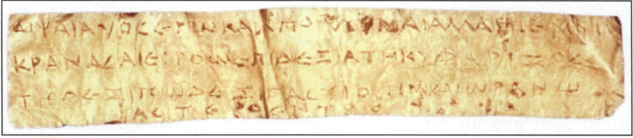
Εικ. 2 Ενεπίγραφο επιστόμιο από την Ελεύθερα (Εθνικό Αρχαιολογικό Μουσείο, Συλλογή Αγγείων αρ. 632 = IC II.xii [Eleutherna].31a)