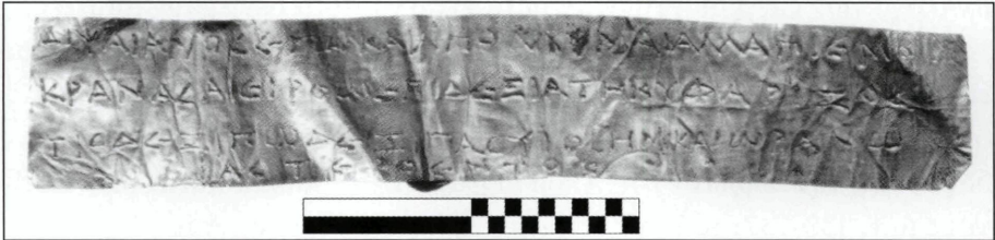
Εικ. 3 Ενεπίγραφο επιστόμιο από την Ελεύθερα (Εθνικό Αρχαιολογικό Μουσείο, Συλλογή Αγγείων αρ. 632 = IC II.xii [Eleutherna].31a, ασπρόμαυρη φωτ. Σ.Ν. Στουρνάρας)

Από τα εννιά ελάσματα της Κρήτης τα επτά φέρουν με μικρές παραλλαγές το εξής κείμενο σε τρεις δακτυλικούς εξαμέτρους στίχους με ιδιαίτερότητες (βλέπε Εικ. 2 και 3: ενεπίγραφο επιστόμιο από την Ελεύθερα, Εθνικό Αρχαιολογικό Μουσείο, Συλλογή Αγγείων αρ. 632 = IC II.xii [Eleutherna].31a): 13