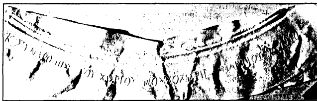
Η επιγραφή στην καμπάνα.

δευτέρος ναός του χωριού, χτισμένος στον κάμψο μακάρι. Όσοι έχουν καταβεί μεχρι εκεί σήγουρα έχωχρίσαν την εντοιχισμένη πλάκα από γκριζωπό μάρμαρο και προσπάθη-